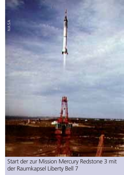
Start der zur Mission Mercury Redstone 3 mit der Raumkapsel Liberty Bell 7

In 6400 Meter Höhe öffnete sich der Stabilisierungsfallschirm. Der Hauptfallschirm wurde in 3750 Metern Höhe ausgeworfen. Der Fallschirm war zunächst noch gerefft, und Grissom beobachtete, wie sich die Reffleinen lösten und der Fallschirm entfaltete. Zu seinem Schrecken bemerkte er, dass sich in einer der Bahnen ein großer, L-förmiger Riß befand. Zum Glück vergrößerte er