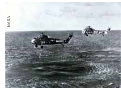
Liberty Bell 7 ist bereits unter Wasser