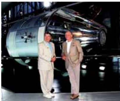
Schirra und Neil Armstrong etwa 2004

onskontrolle später verkündete, die elftägige Mission (die zweitlängste im ganzen Apollo-Programm) sei ein 101 prozentiger Erfolg und zum anderen wegen Schirras ständigem Streites mit eben dieser Missionskontrolle. Die Bodencrew wollte nicht zur Kenntnis nehmen, dass die ganze Besatzung sich eine schwere Erkältung geholt hatte, und setzte ständig neue Experimente an. Nach einer Weile sagte Schirra jedes weitere Experiment ab und gab Christopher Kraft, dem Flugdirektor bekannt, dass ab jetzt er die Regeln dieser Mission bestimmen würde. Bei der Landung weigerte sich die Crew, die Raumanzüge anzulegen, obwohl ihnen das von der Flugkontrolle befohlen worden war. Schirra verkündete aber, dass aufgrund der durch die Erkältung verstopften Atemwege ein manueller Druckausgleich (durch Pressen in die zugehaltene Nase) nötig sei, und das gehe nicht im Raumanzug.