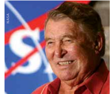
Eines der letzten Bilder von Wally Schirra.

Nach Schirras Tod leben nur noch zwei aus dem legendären Kreis der Mercury 7: Scott Carpenter und John Glenn. Virgil Grissom kam 1967 bei der Feuerkatastrophe von Apollo 1 ums Leben, Deke Slayton starb im Jahre 1993 an einem Gehirntumor, Alan Shepard, der als einziger der ursprünglichen sieben auf dem Mond landete, starb 1998 und Gordon Cooper verschied im Jahre 2004.