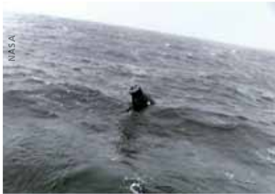
Unmittelbar nach der Landung: Liberty Bell 7 liegt schon tief im Wasser