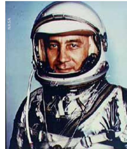
Virgil Grissom vor der Mission Mercury Redstone 3 „Liberty Bell“.

te Helikopter und Grissom war nun mitten in den beiden Abwindzonen und konnte weder auf die eine noch auf die andere Seite schwimmen. Der Astronaut war in der Zwischenzeit schon völlig erschöpft, nahm aber noch einmal alle Kräfte zusammen und schwamm gegen die Winddrift des ersten Helikopters eine Strecke von etwa 30 Metern auf den zweiten Helikopter mit dem Rettungskragen zu. Dann erreichte er den Horse-Collar. Er zog sich mit letzter Kraft hinein, rückwärts statt vorwärts, und die Winch zog ihn nach oben. Als er