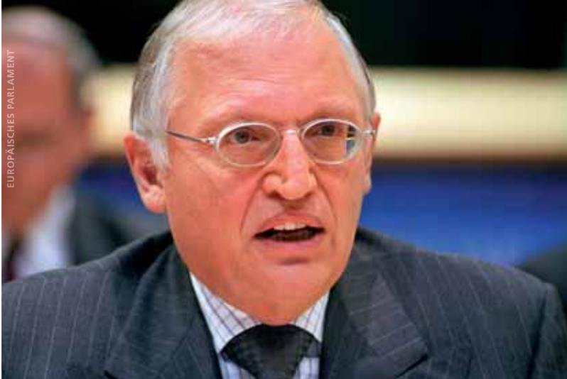
Günter VERHEUGEN – Vize-Präsident, Kommissar für Unternehmen und Industrie