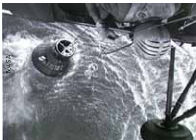
Liberty Bell 7 wird vom Bergungshelikopter Hunt Club 1 fotografiert. Noch sieht alles normal aus