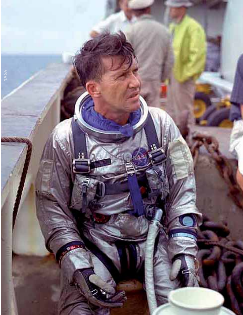
Wally Schirra im Projekt Gemini