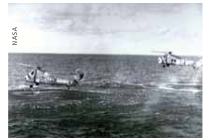
Liberty Bell 7 ist verloren. Irgendwo da draußen kämpft Virgil Grissom um sein Leben