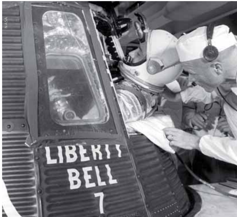
Vor dem Start: Virgil Grissom klettert in die Liberty Bell 7