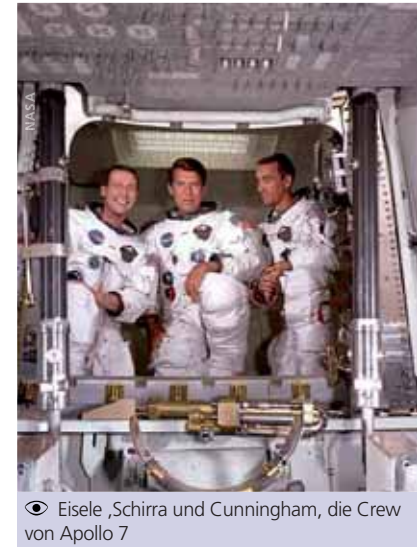
👁 Eisele, Schirra und Cunningham, die Crew von Apollo 7

Der Flug von Sigma 7 ging als die „Engineering-Mission“ in die Raumfahrtgeschichte ein. Dieser Flug stärkte die Rolle der Astronauten als