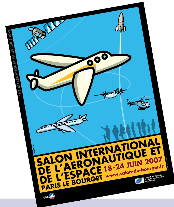
Der Pariser Aero-Salon, eine der international bedeutendsten Messen in Sachen Luft- und Raumfahrt.

Virgin Galactic, kennt als Europäer Bürokraten vom Schlage eines Günter Verheugen nur allzu gut. Er machte deshalb von vorneherein keinerlei Anstalten, seine neue Unternehmung in Europa anzusiedeln. Lieber legte er sein Geld, vorläufig eine viertel Milliarde Euro, in den USA an. Dort steht man dem Thema aufgeschlossen gegenüber und hat in kurzer Zeit ein positives Umfeld für die Realisierung suborbitaler Raumfahrt geschaffen. Nichts davon ist auf dem alten Kontinent zu sehn. Hier ist zu befürchten, dass Verheugen und Co das gerade aufkeimende Pflänzchen „Private Raumfahrt“ mit Vorschriften, komplexen Regularien und Verboten überziehen werden. Und sei es nur, um es den „Superreichen“ mal so richtig zu zeigen.