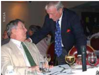
Schirra und Scott Carpenter etwa 2004