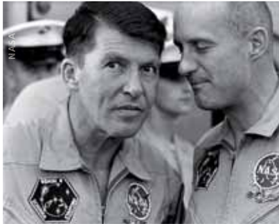
Wally Schirra und sein Pilot Tom Stafford in Gemini 6