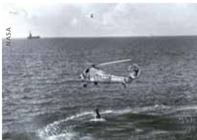
Liberty Bell 7 ist vollgelaufen und zieht Hunt Club 1 nach unten

sich aber nicht. Grissom ließ den Fallschirm aber während des Abstiegs nicht aus den Augen. Die Wasserung erfolgte um 13.35 Uhr, 486 Kilometer vom Startort entfernt. Die Landung war nicht so hart, wie Grissom sie erwartet hatte, aber die Kapsel kenterte zunächst, bevor sie sich in aufrechter Position stabilisierte. Die Wasserung erfolgte fünf Kilometer vom Bergungsschiff entfernt, dem Kreuzer USS Randolph. Im Inneren des Raumfahrzeugs ging Grissom jetzt die sogenannte „Post Flight Checklist“ durch. Das heißt, er aktivierte mittels einer Tabelle alle für die Bergung notwendigen Systeme und schaltete alle Flugsysteme aus. Er deaktivierte den Reserve-Fallschirm, warf eine Kommunikationsantenne aus und stöpselte die Versorgungsleitungen zum Raumanzug ab. Dann begann er den sogenannten „Nackendamm“ zu entrollen, eine Art Gummidichtung am Halsteil des Raumanzugs, die das Eindringen von Wasser verhindern sollte, für den Fall dass er schwimmen müsste. Was er in der Hektik dieser Momente nicht bemerkte, war, dass sich dieser Nackendamm nicht vollständig entrollte, und auch nicht dicht am Hals anlag. Während sich Grissom noch mit dem Anzug plagte, kam ein Funkspruch vom Bergungshubschrauber „Hunt-